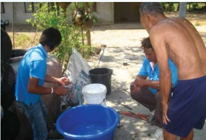
สาขาที่ 123 สำนักงานประปามหาชนะชัย