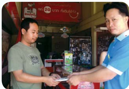
สาขาที่ 64 สำนักงานประปาแม่ชะจาน เมื่อวันที่ 26 มีนาคม 2552