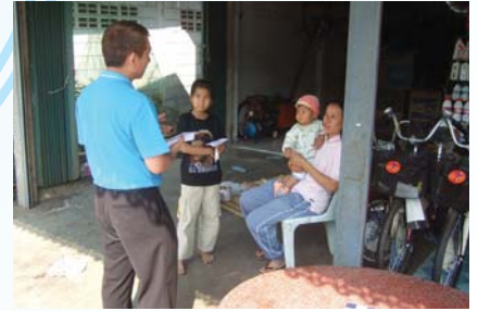
สาขาที่ 113 สำนักงานประปาศรีเชียงใหม่