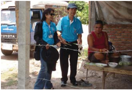
สาขาที่ 114 สำนักงานประปาสว่างแดนดิน