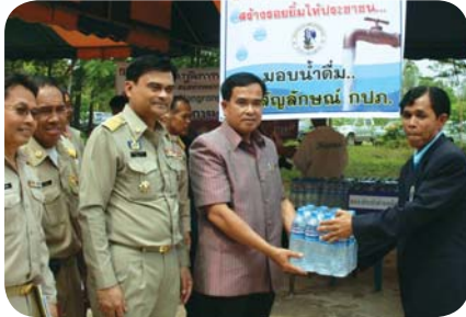
สาขาที่ 43 สำนักงานประปาบางรอง เมื่อวันที่ 10 มีนาคม 2552