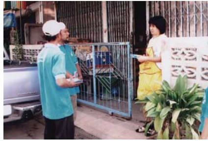
สาขาที่ 91 สำนักงานประปาท่าเรือ