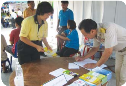
สาขาที่ 46 สำนักงานประปาฉะเชิงเทรา เมื่อวันที่ 12 มีนาคม 2552