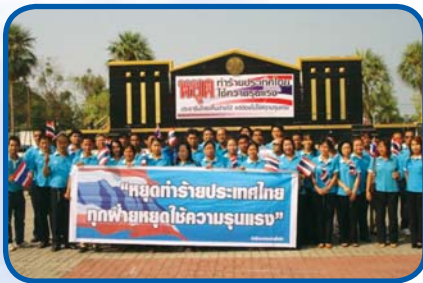
สำนักงานประปาสุโขทัย สำนักงานประปาศรีสำโรง สำนักงานประปาสวรรคโลก สำนักงานประปาศรีลพบุรี