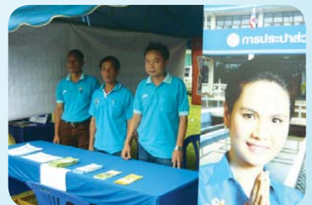
สาขาที่ 77 สำนักงานประปาจุน เมื่อวันที่ 27 เมษายน 2552