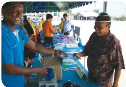
สาขาที่ 70 สำนักงานประปาสายบุรี เมื่อวันที่ 22 เมษายน 2552