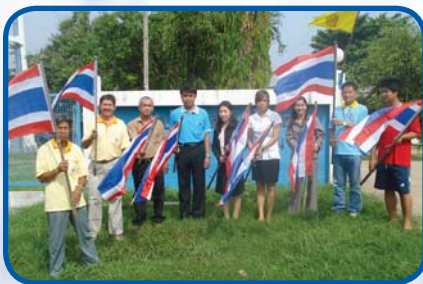
สำนักงานประปาหนองไผ่