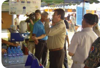
สาขาที่ 44 สำนักงานประปาพิจิตร เมื่อวันที่ 11 มีนาคม 2552