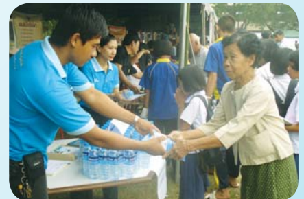
สาขาที่ 54 สำนักงานประปาหนองไผ่ เมื่อวันที่ 19 มีนาคม 2552