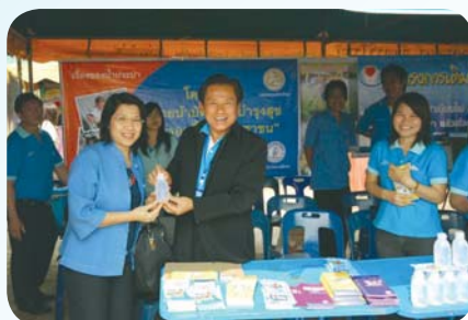
สาขาที่ 59 สำนักงานประปาเชียงใหม่ เมื่อวันที่ 25 มีนาคม 2552