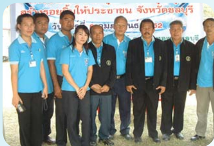
สาขาที่ 34 สำนักงานประปาพนสนธิคม เมื่อวันที่ 6 กุมภาพันธ์ 2552

“น้ำ” ฉบับนี้ขอนำเสนอหน่วยบริการ “น้ำเคลื่อนที่” จากสำนักงานประปาสาขาต่าง ๆ ที่ทยอยเปิดให้บริการเพื่อสร้างความสุขให้ประชาชน ซึ่งขณะนี้ก็มีจำนวน 77 สาขาแล้ว ดังนี้