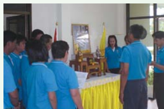
สำนักงานประปาแม่ริม