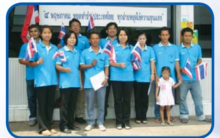
สำนักงานประปาอุดรดิตถ์