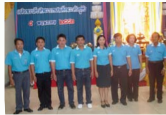
สำนักงานประปาแพร่