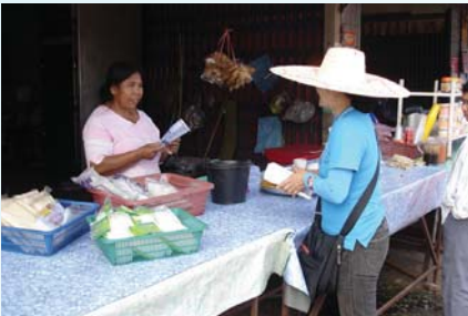
สาขาที่ 117 สำนักงานประปาบ้านแพง