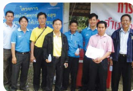
สาขาที่ 60 สำนักงานประปาท่าวังผา เมื่อวันที่ 25 มีนาคม 2552