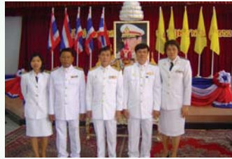
สำนักงานประปาประจวบคีรีขันธ์