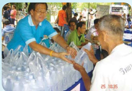
สาขาที่ 58 สำนักงานประปาอรัญประเทศ เมื่อวันที่ 25 มีนาคม 2552