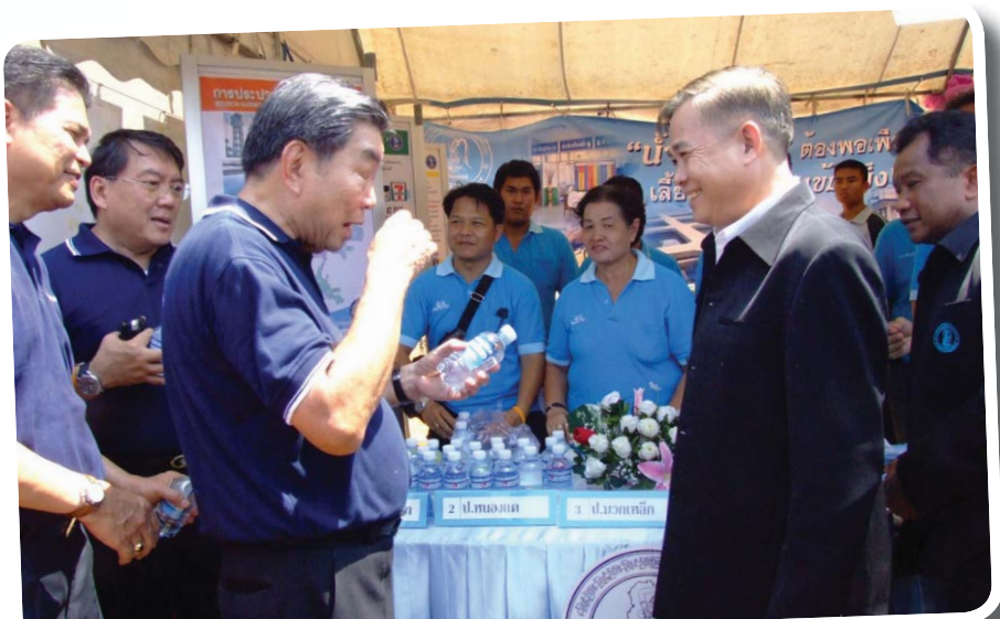
สาขาที่ 40 สำนักงานประปาหนองแค สาขาที่ 41 สำนักงานประปามวกเหล็ก สาขาที่ 42 สำนักงานประปาบ้านหม้อ เมื่อวันที่ 6 มีนาคม 2552