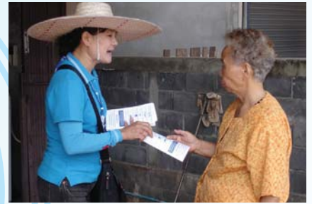
สาขาที่ 107 สำนักงานประปาบ้านผือ