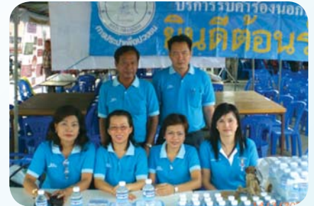
สาขาที่ 48 สำนักงานประปารังสิต เมื่อวันที่ 14 มีนาคม 2552