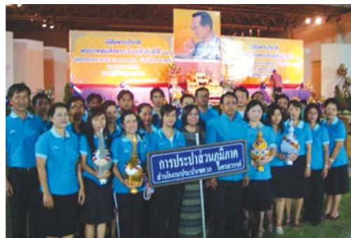
สำนักงานประปาเขต 10 สำนักงานประปาลาดยาว สำนักงานประปาพุทธะคีรี