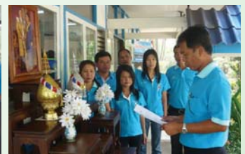
สำนักงานประปาจุน