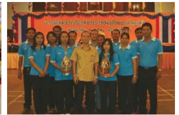
สำนักงานประปาสุนทร