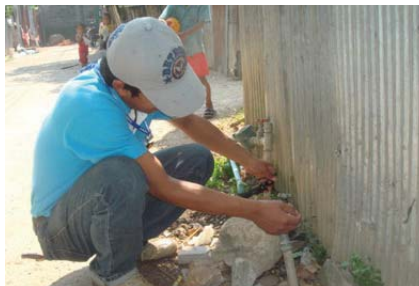
สาขาที่ 130 สำนักงานประปามะสอด