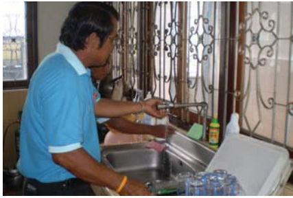
สาขาที่ 90 สำนักงานประปาหนองแค