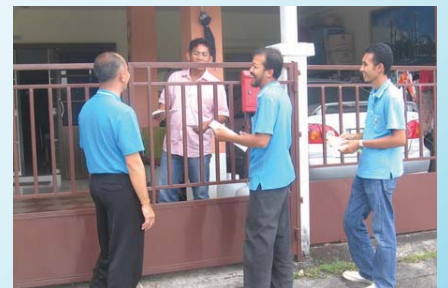
สาขาที่ 100 สำนักงานประปาพังงา