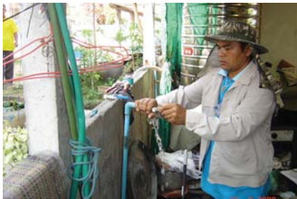
สาขาที่ 94 สำนักงานประปาสีคิ้ว