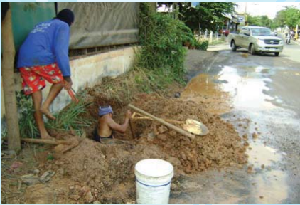
สาขาที่ 105 สำนักงานประปากระนวน