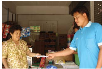
สาขาที่ 109 สำนักงานประปาเชียงคาน