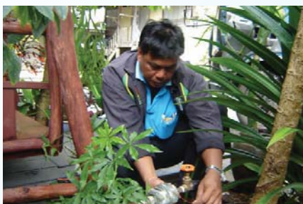
สาขาที่ 102 สำนักงานประปาพัทลุง