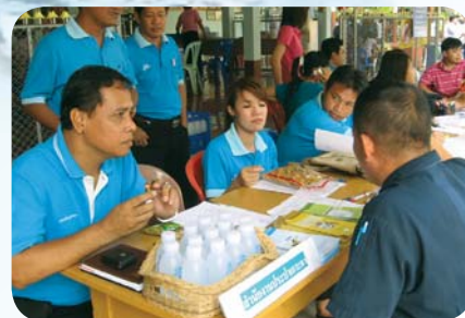
สาขาที่ 57 สำนักงานประปาเกาะคา เมื่อวันที่ 20 มีนาคม 2552