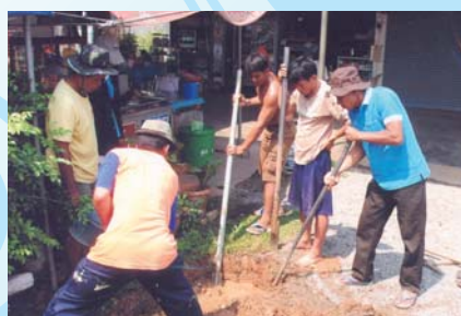
สาขาที่ 133 สำนักงานประปาหล่มสัก