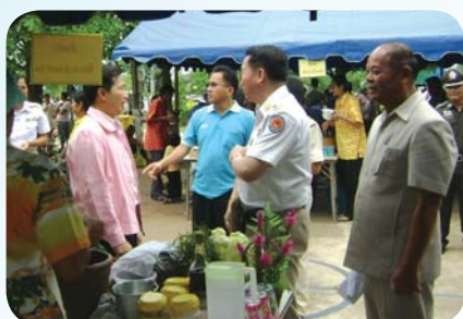
สาขาที่ 61 สำนักงานประปาภูเขียว เมื่อวันที่ 26 มีนาคม 2552