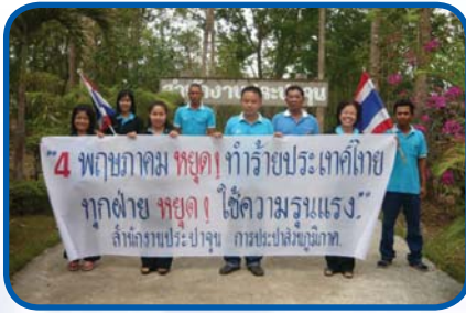
สำนักงานประปาจันทบุรี