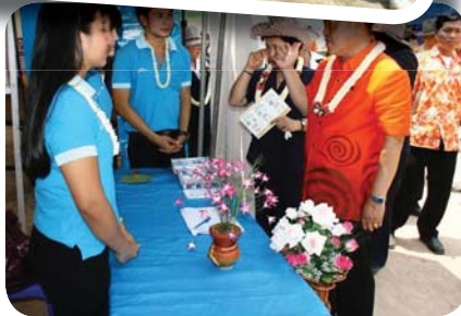
สาขาที่ 67 สำนักงานประปาอุดรธานี เมื่อวันที่ 8 เมษายน 2552