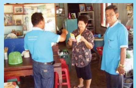
สาขาที่ 134 สำนักงานประปาชนแดน