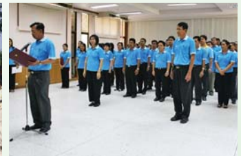
สำนักงานประปาเขต 5