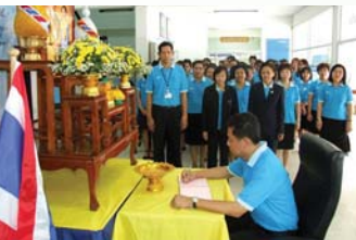
สำนักงานประปาเขต 8