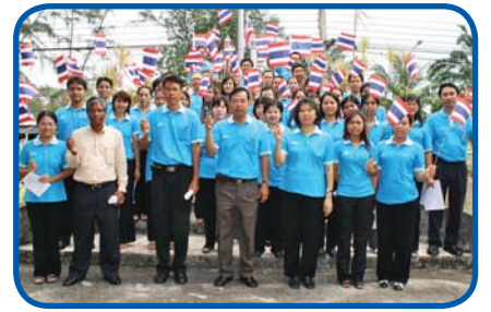
สำนักงานประปาเขต 5