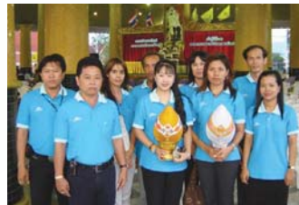
สำนักงานประปาแม่สอด