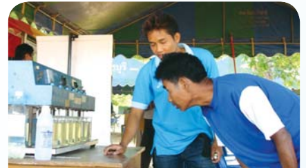
สาขาที่ 68 สำนักงานประปารัตนบุรี เมื่อวันที่ 12 เมษายน 2552