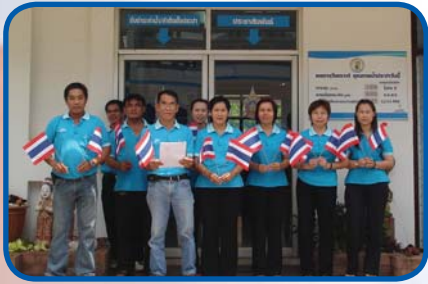
สำนักงานประปาพะเยา