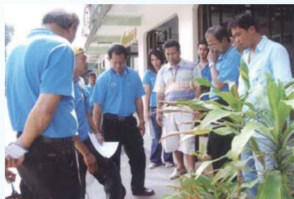
สาขาที่ 99 สำนักงานประปาประมง