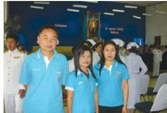
สำนักงานประปาจุน