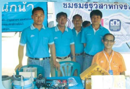
สาขาที่ 55 สำนักงานประปาอ่างทอง เมื่อวันที่ 19 มีนาคม 2552