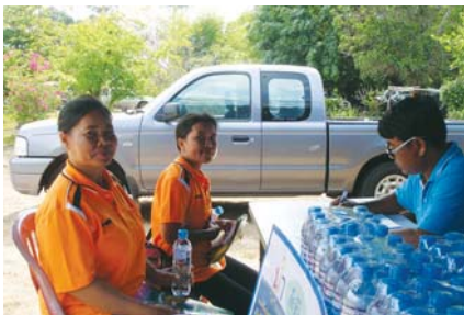
สาขาที่ 120 สำนักงานประปาเดชอุดม