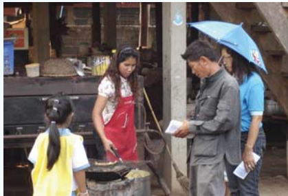
สาขาที่ 118 สำนักงานประปาศรีสงคราม