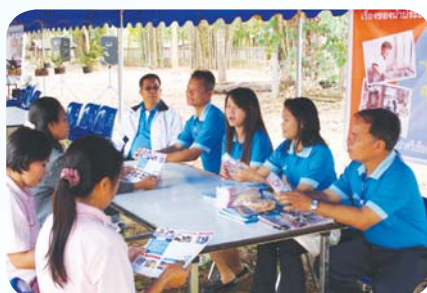
สาขาที่ 62 สำนักงานประปาศรีเชียงใหม่ เมื่อวันที่ 26 มีนาคม 2552