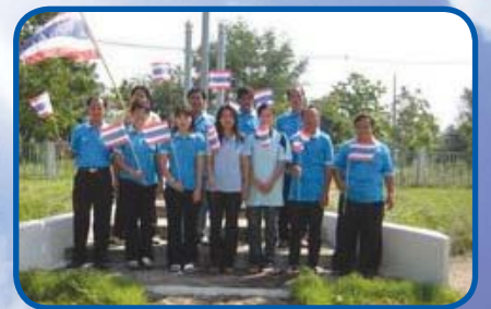
สำนักงานประปาวิเชียรบุรี