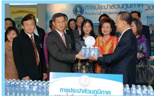
โครงการสานน้ำใจบรรเทาสาธารณภัย