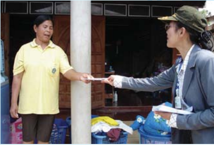
สาขาที่ 111 สำนักงานประปาวังสะพุง