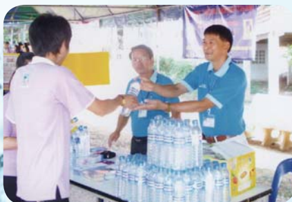
สาขาที่ 76 สำนักงานประปาบ้านนา เมื่อวันที่ 24 เมษายน 2552