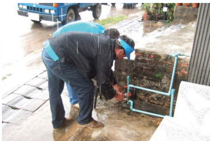
สาขาที่ 98 สำนักงานประปาท่ามะ