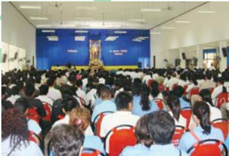
สำนักงานประปาพะเยา