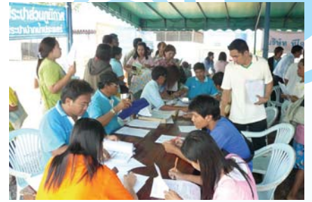
สาขาที่ 88 สำนักงานประปาปากน้ำประแสร์