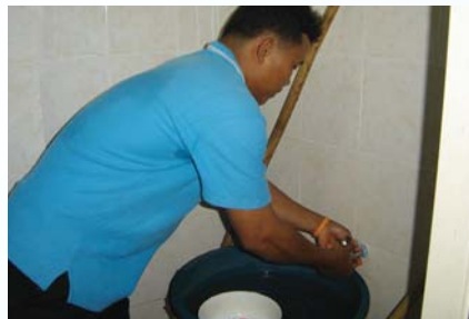
สาขาที่ 121 สำนักงานประปาอำนาจเจริญ