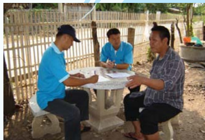
สาขาที่ 127 สำนักงานประปาบ้านไผ่