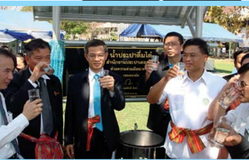
โครงการน้ำประปาดื่มได้

โครงการณรงค์ใช้น้ำอย่างรู้คุณค่า ... รักษาทรัพยากรน้ำอย่างยั่งยืน