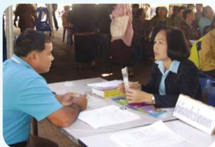
สาขาที่ 37 สำนักงานประปาสกลนคร เมื่อวันที่ 6 กุมภาพันธ์ 2552