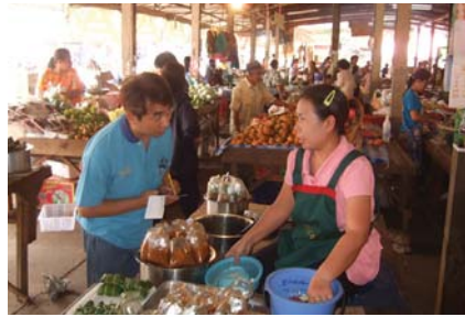
สาขาที่ 115 สำนักงานประปาพังโคน