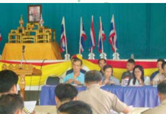
สำนักงานประปาร้อยแก้ว