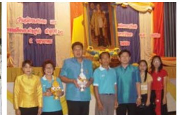
สำนักงานประปាកำแพงเพชร