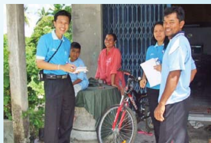
สาขาที่ 103 สำนักงานประปาละงู