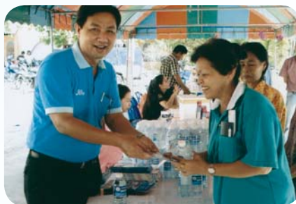
สาขาที่ 38 สำนักงานประปาท่าเรือ เมื่อวันที่ 26 กุมภาพันธ์ 2552