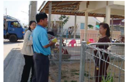
สาขาที่ 119 สำนักงานประปาอุบลราชธานี