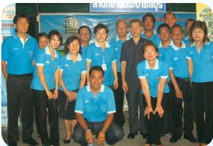
สาขาที่ 75 สำนักงานประปาชลบุรี เมื่อวันที่ 24 เมษายน 2552