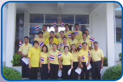
สำนักงานประปาประจวบคีรีขันธ์