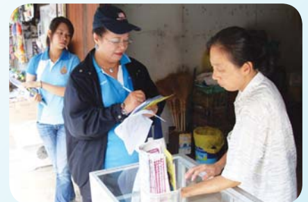
สาขาที่ 51 สำนักงานประปาจันทบุรี เมื่อวันที่ 18 มีนาคม 2552