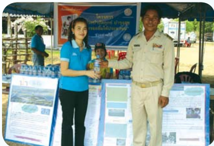
สาขาที่ 52 สำนักงานประปาเดชอุดม เมื่อวันที่ 18 มีนาคม 2552