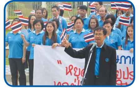
สำนักงานประปาเขต 9