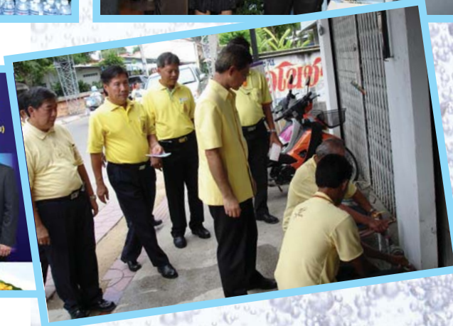
โครงการเติมใจให้กัน