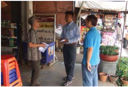
สาขาที่ 108 สำนักงานประปาบ้านดุง