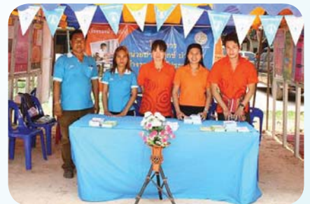
สาขาที่ 71 สำนักงานประปาบ้านดุง เมื่อวันที่ 22 เมษายน 2552