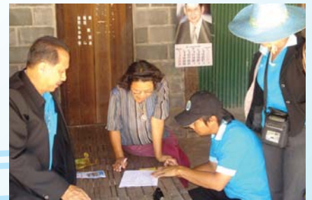
สาขาที่ 122 สำนักงานประปาเลิงนกทา