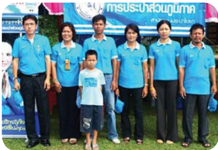
สาขาที่ 69 สำนักงานประปาไชยา เมื่อวันที่ 21 เมษายน 2552