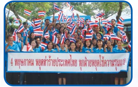
สำนักงานประปาเขต 10