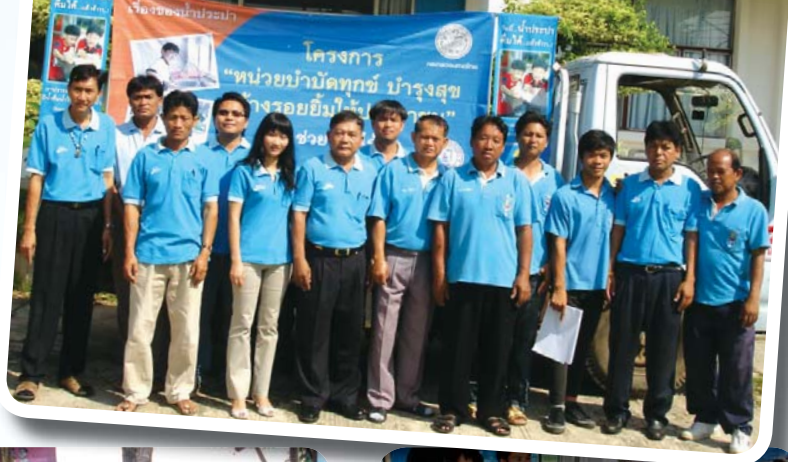
สาขาที่ 65 สำนักงานประปาสตึก เมื่อวันที่ 7 เมษายน 2552