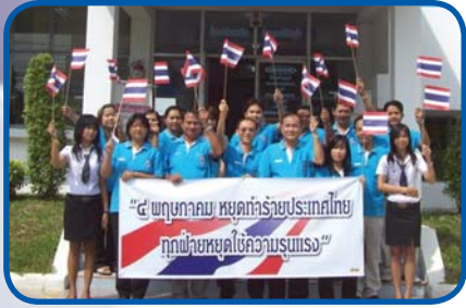
สำนักงานประปาสุรินทร์