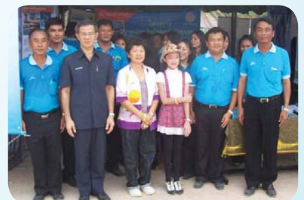
สาขาที่ 74 สำนักงานประปาระยอง เมื่อวันที่ 24 เมษายน 2552