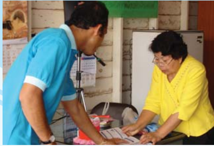
สาขาที่ 112 สำนักงานประปาบังภาพ