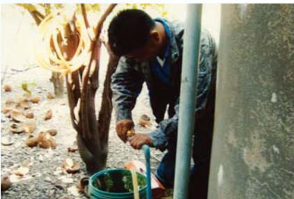
สาขาที่ 129 สำนักงานประปาเถิน