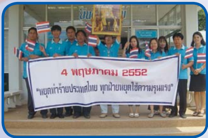
สำนักงานประปាកำแพงเพชร