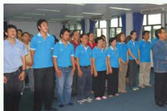
สำนักงานประปาเชียงใหม่