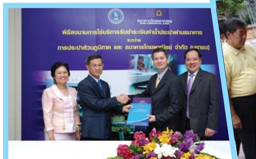
โครงการเพิ่มช่องทางการชำระน้ำประปา เพื่อความสะดวกของลูกค้า