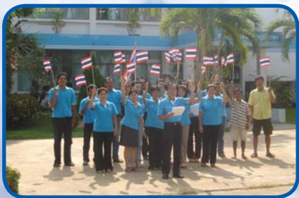
สำนักงานประปาพิจิตร