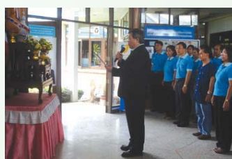
สำนักงานประปาเขต 10