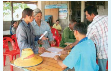
สาขาที่ 96 สำนักงานประปากุยบุรี