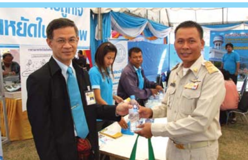
โครงการหน่วยบำบัดทุกข์บำรุงสุข สร้างรอยยิ้มให้ประชาชน