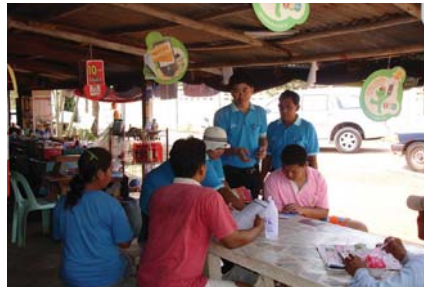
สาขาที่ 87 สำนักงานประปาบางค้อ