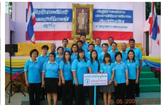
สำนักงานประปาพิษณุโลก สำนักงานประปานครไทย