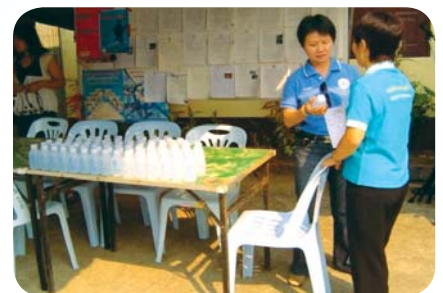
สาขาที่ 39 สำนักงานประปาแม่สาย เมื่อวันที่ 4 มีนาคม 2552