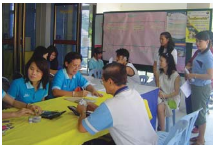
สาขาที่ 126 สำนักงานประปาเชียงใหม่