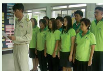
สำนักงานประปាកำแพงเพชร