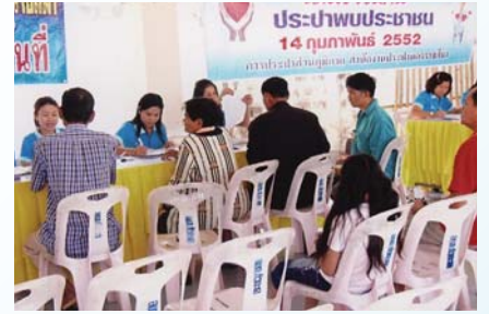
สาขาที่ 92 สำนักงานประปานครราชสีมา