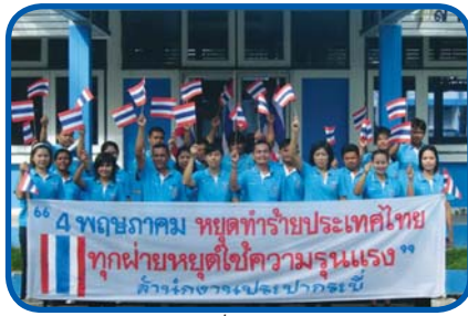
สำนักงานประปากระบี่