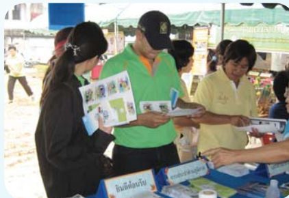
สาขาที่ 53 สำนักงานประปาลำปาง เมื่อวันที่ 18 มีนาคม 2552