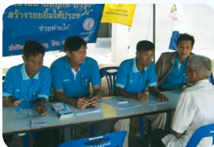
สาขาที่ 73 สำนักงานประปาลง เมื่อวันที่ 23 เมษายน 2552