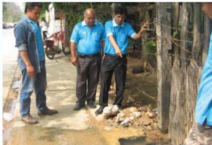
สาขาที่ 124 สำนักงานประปามางรอง