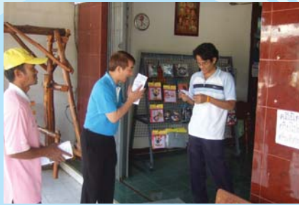
สาขาที่ 106 สำนักงานประปาภูมิภาชี