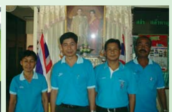
สำนักงานประปาอุทัยธานี