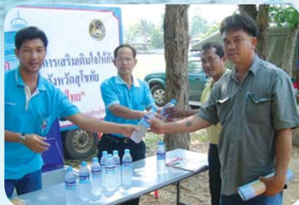
สาขาที่ 56 สำนักงานประปาศรีสำโรง เมื่อวันที่ 19 มีนาคม 2552