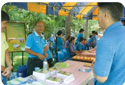
สาขาที่ 72 สำนักงานประปamahaxanachai เมื่อวันที่ 22 เมษายน 2552