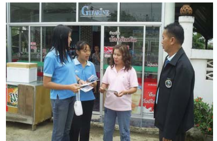
สาขาที่ 131 สำนักงานประปาทุ่งเสลี่ยม