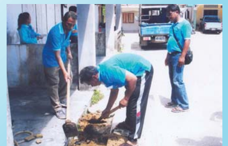
สาขาที่ 104 สำนักงานประปาราชวิาส