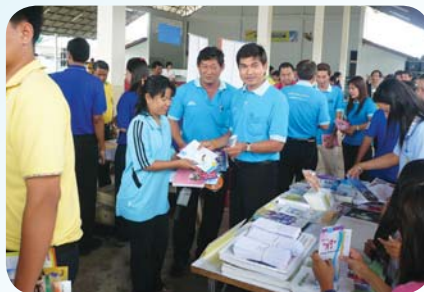
สาขาที่ 35 สำนักงานประปาปากน้ำประแสร์ เมื่อวันที่ 6 กุมภาพันธ์ 2552