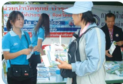
สาขาที่ 50 สำนักงานประปาศรีราชา เมื่อวันที่ 18 มีนาคม 2552