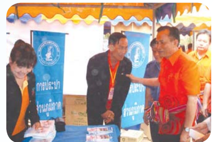
สาขาที่ 36 สำนักงานประปากุมภวาปี เมื่อวันที่ 6 กุมภาพันธ์ 2552