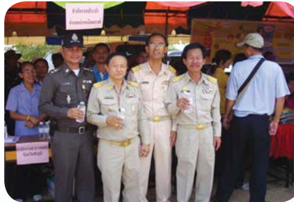
สาขาที่ 47 สำนักงานประปาบำเหน็จณรงค์ เมื่อวันที่ 13 มีนาคม 2552