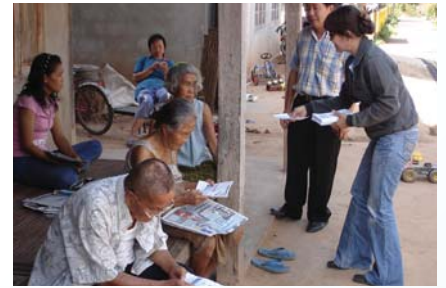
สาขาที่ 110 สำนักงานประปาด่านซ้าย