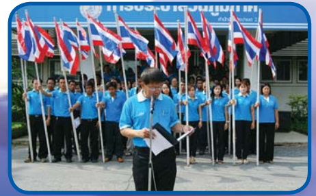
สำนักงานประปาเขต 2