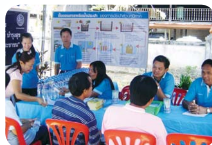
สาขาที่ 63 สำนักงานประปาอำนาจเจริญ เมื่อวันที่ 26 มีนาคม 2552