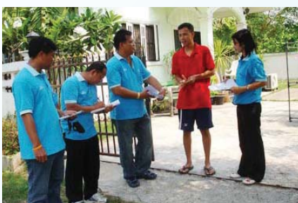
สาขาที่ 132 สำนักงานประปาเพชรบูรณ์