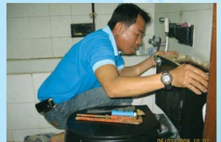
สาขาที่ 128 สำนักงานประปาเกาะคา