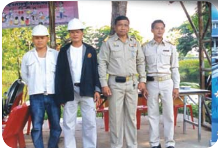
สาขาที่ 66 สำนักงานประปาปักธงชัย เมื่อวันที่ 8 เมษายน 2552