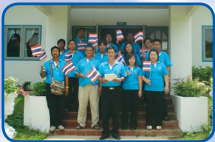
สำนักงานประปาขามเฒ่าลพบุรี