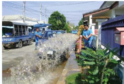
สาขาที่ 95 สำนักงานประปากาญจนบุรี