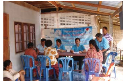
สาขาที่ 125 สำนักงานประปารัตนบุรี