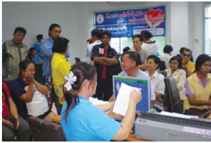
สาขาที่ 86 สำนักงานประปาพนัสนิคม