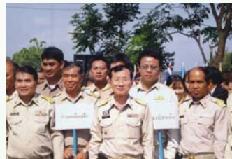
สำนักงานประปาบกธงชัย