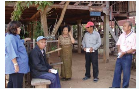
สาขาที่ 116 สำนักงานประปาธาตุพนม