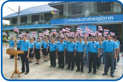
สำนักงานประปาเขต 8, สำนักงานประปาอุบลราชธานี