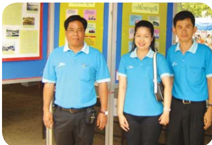
สาขาที่ 49 สำนักงานประปาพาน เมื่อวันที่ 17 มีนาคม 2552