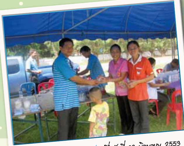
สาขาที่ 152 กมก.สาขาสันติสุข เมื่อวันที่ 23 มิถุนายน 2553