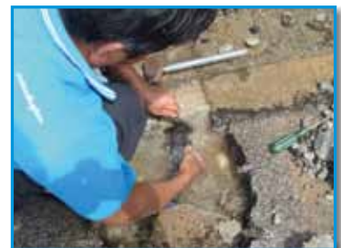
ภาพที่ 210 สภากาชาดโรงเรียน