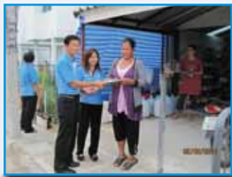
สภาที่ 165 สภามันมอ