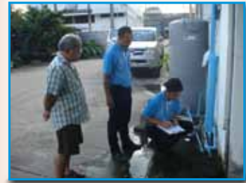
ภาพที่ 179 สภาทตมร