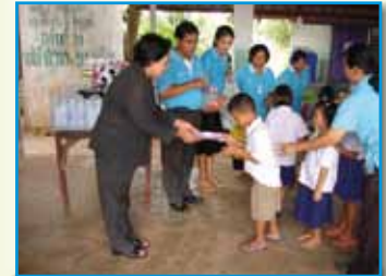
สภาที่ 161 สภามางดล