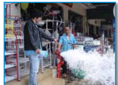
ภาพที่ 186 สภามณน