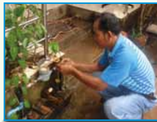
สถานี 190 สถานีวังกาฬ