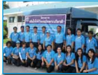
สภาที่ 160 สภาทักมา