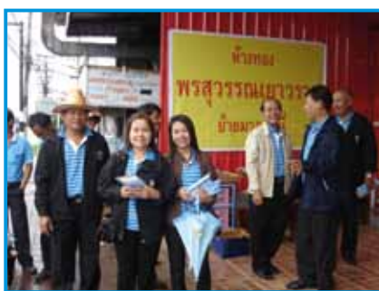
สถานี 195 สถานีโพธิ์