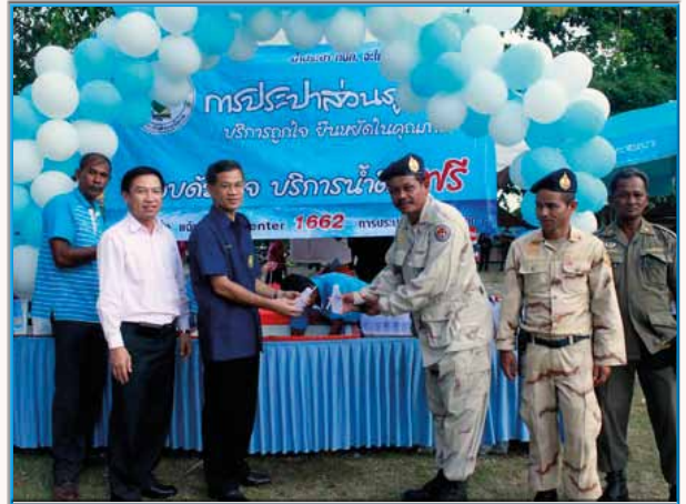
สาขาที่ 155 กมก.สาขานครศรีธรรมราช เมื่อวันที่ 24 กันยายน 2553