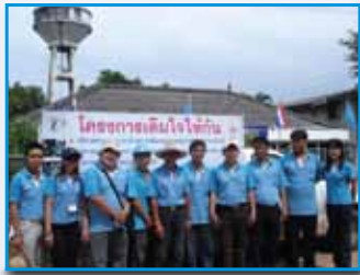
ภาพที่ 199 สภากาชาดโรงพยาบาล