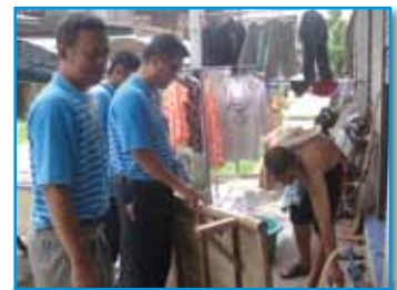
ภาพที่ 204 สภากาชาดโรงเรียน