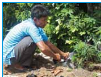
สภาที่ 172 สภานวนนก