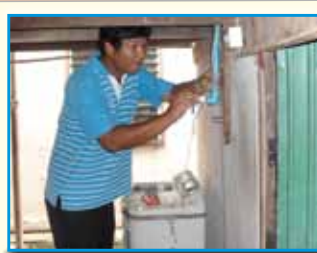
สภาที่ 166 สภามันมอ