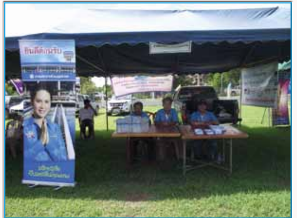
สาขาที่ 153 กมก.สาขาทุ่งเสลี่ยม เมื่อวันที่ 5 สิงหาคม 2553