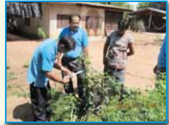
ภาพที่ 176 สภาดำนกมด