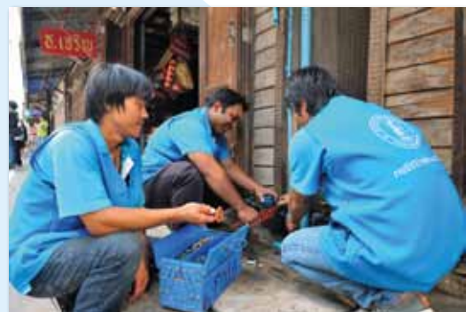
พนักงาน กปภ. ออกพบลูกค้าถึงบ้าน พร้อมบริการด้วยไมตรีจิต เพื่อสังคมไทยได้อยู่ร่วมกันอย่างมีความสุข