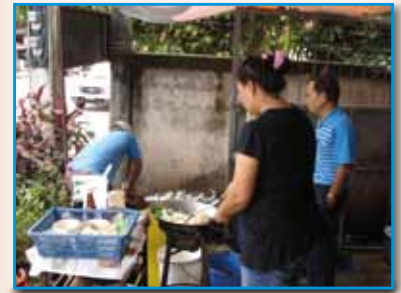
สถานี 191 สถานีวังใหม่