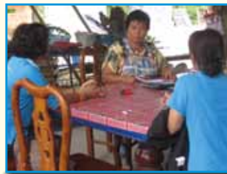
สถานี 193 สถานีกลนคร