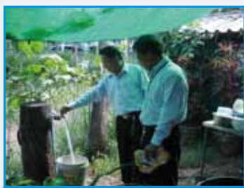
สถานี 192 สถานีโพธิ์สัย