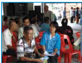
สภาที่ 168 สภาวิเศษชัยชาญ