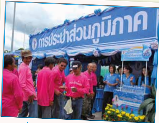
สาขาที่ 154 กมก.สาขาเลย เมื่อวันที่ 27 สิงหาคม 2553