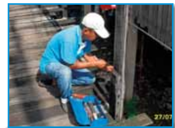
สภาที่ 170 สภาสน