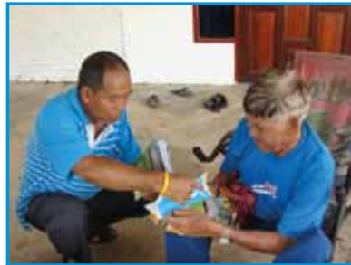
ภาพที่ 206 สภากาชาดโรงเรียน