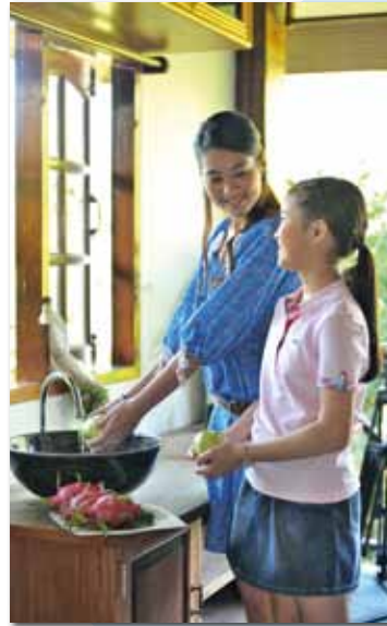
ถ้าเราใช้น้ำอย่างประหยัด เราก็จะมีสุขภาพดี เพราะมีน้ำสะอาด จากก๊อก มาให้เราดื่ม หรือใช้ล้างผลไม้แบบนี้ ตลอดไปนะจ๊ะ