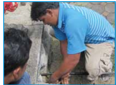
ภาพที่ 181 สภากรม