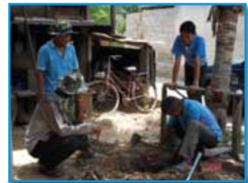
ภาพที่ 207 สภากาชาดโรงเรียน