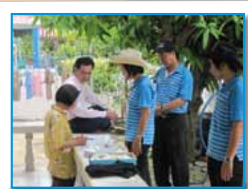
สภาที่ 167 สภาสิงบุรี