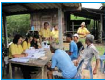
ภาพที่ 205 สภากาชาดโรงเรียน