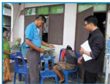
ภาพที่ 183 สภาทตม