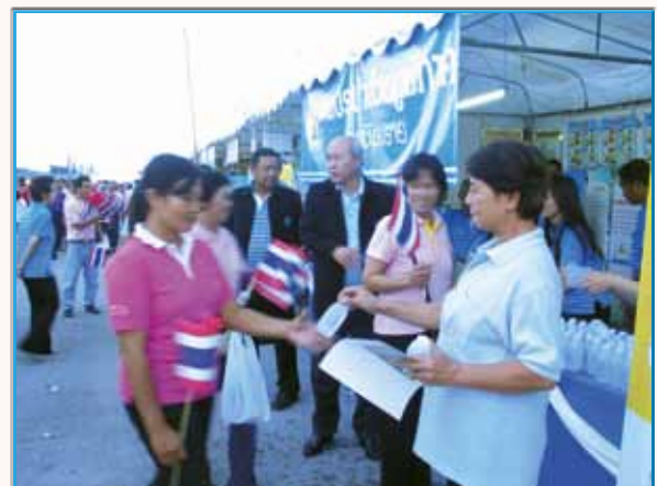
ภาพที่ 159 นก.สาทเชียงราช เมื่อวันที่ 22 ตุลาคม 2553