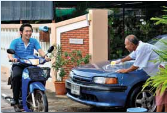
สวัสดีครับคุณลุง ... อ้าวไอ้หนูจะไปทำงานแล้วหรอ ... ครับผม ... แหมคุณลุงล้างรถแบบนี้ช่วย ประหยัดน้ำ ถึง 10 เท่า เลยนะครับ มีน้ำล่ะ ... ค่าน้ำบ้านลุง ถึงไม่มากเลย ... ผมไปล่ะนะ เย็นนี้เจอกันครับ