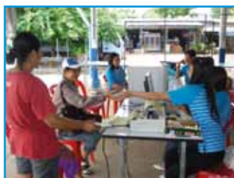
ภาพที่ 185 สภาทตม