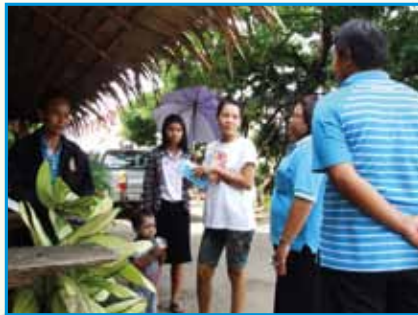
ภาพที่ 202 สภากาชาดโรงเรียน