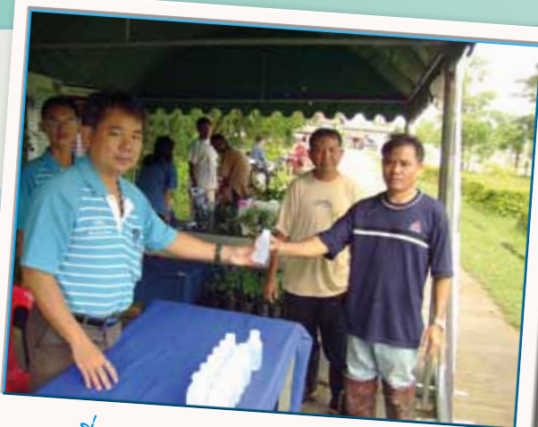
ภาพที่ 158 นก.สาทกิง เมื่อวันที่ 15 ตุลาคม 2553

หน่วยบริการของ กป. จะไม่หยุดแต่เพียงเท่านี้ แต่ยังคงมุ่งหน้าขยายหน่วยบริการเพื่อสร้างรอยยิ้มให้ชุมชนต่อไปเรื่อย ๆ ซึ่งขณะนี้หน่วยบริการเคลื่อนที่ครอบคลุมพื้นที่ถึง 159 สาขาแล้ว