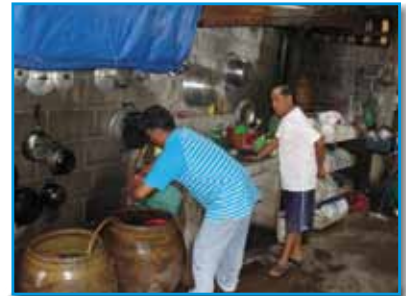
ภาพที่ 201 สภากาชาดโรงเรียน