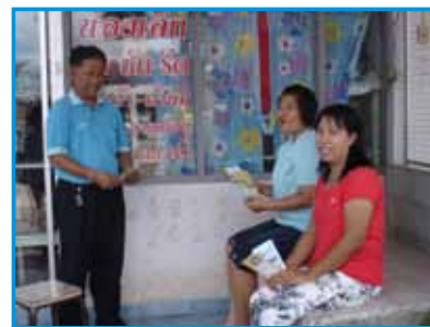
สถานี 196 สถานีตรัง