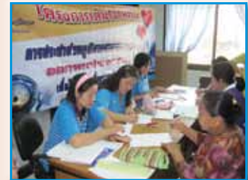
สภาที่ 164 สภานองแดง