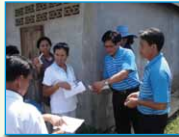
สถานี 188 สถานีเชียงตาน