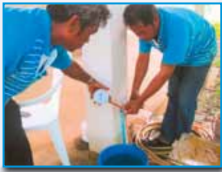
ภาพที่ 174 สภาทตมร