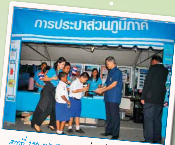
ภาพที่ 156 นก.สาทสกล เมื่อวันที่ 29 กันยายน 2553