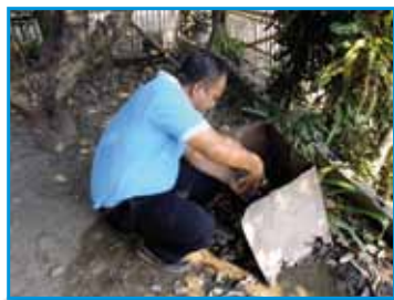
ภาพที่ 208 สภากาชาดโรงเรียน