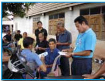
สถานี 189 สถานีสระบุรี