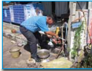
ภาพที่ 175 สภาโธดธ