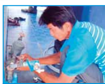
สภาที่ 169 สภามักใน