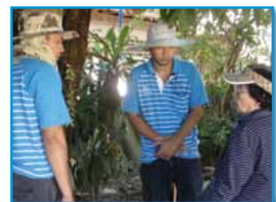
สถานี 198 สถานีบ้านแพง