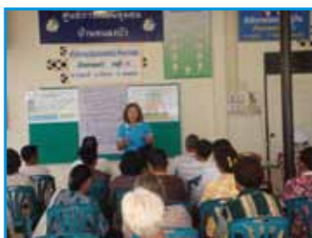
ภาพที่ 184 สภาทตม