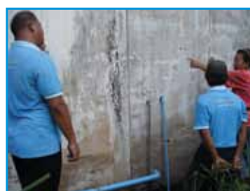
สถานี 197 สถานีสุพรรณ