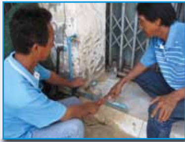
สถานี 187 สถานีเกษตร