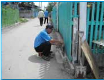
ภาพที่ 177 สภาสภมรสงม