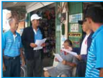
ภาพที่ 180 สภามณนส