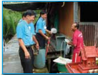
สภาที่ 163 สภาคลองใน