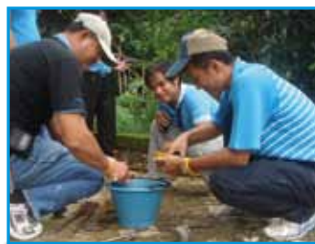
ภาพที่ 209 สภากาชาดโรงเรียน