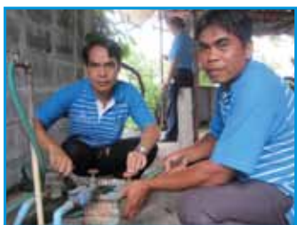
สภาที่ 171 สภานวนนก