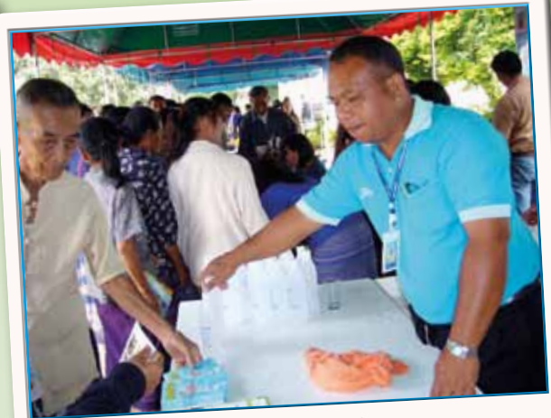
ภาพที่ 157 นก.สาทสอ เมื่อวันที่ 14 ตุลาคม 2553

หาไม่ได้อีกแล้วที่จะมีหน่วยบริการเรื่องน้ำครบกจรเคลื่อนที่ไปทุกแห่งหนตำบลใกล้และไกล ครอบคลุมทั้งอำเภอและ จังหวัดทั่วประเทศ แต่สำหรับ การประชาสัมพันธ์ (กป.) เราทำให้ได้ ด้วยการร่วมมือกับทางจังหวัดจัดหน่วยบริการเคลื่อนที่ ภายใต้โครงการ “หน่วยบำบัดทุกข์ บำรุงสุข สร้างรอยยิ้มให้ประชาชน” และร่วมมือกับทางอำเภอจัดโครงการ “อำเภอยิ้ม... เคลื่อนที่” ตามนโยบายของ ท่านชวรัตน์ ชาญวีรกูล รัฐมนตรีว่าการกระทรวงมหาดไทย ที่ต้องการอำนวยความสะดวกเรื่อง สาธารณูปโภคให้กับประชาชนถึงที่ไม่ว่าจะเป็นเรื่องน้ำ ไฟ โทรศัพท์ และเรื่องอื่น ๆ อีกมากมาย เรียกได้ว่ามา 1 งานได้ครบทุก หน่วยบริการ