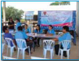
สภาที่ 162 สภาทราย