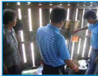
ภาพที่ 203 สภากาชาดโรงเรียน