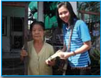
สภาที่ 159 สภาตไร่ราช