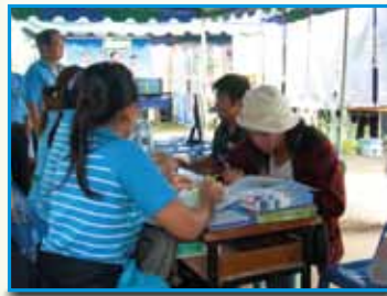
ภาพที่ 178 สภาทตมร