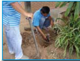
ภาพที่ 200 สภากาชาดอำเภอเจริญ