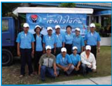
ภาพที่ 182 สภาทตม