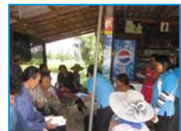
สภาที่ 173 สภามกช่อง