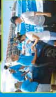
ภาพกิจกรรม CSR ในรั้ว ปวก. ที่จังหวัดบุรีรัมย์ ๒๕๖๓