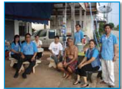
สถานี 194 สถานีสว่างแดนดิน