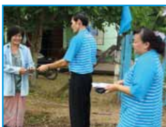
ภาพที่ 211 สภากาชาดโรงเรียน