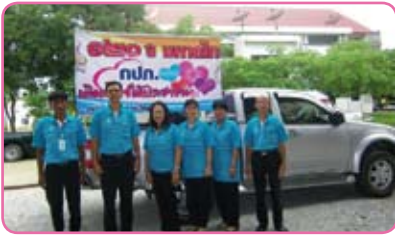
สาขาเลาขวัญ ครั้งที่ 3 วันที่ 27 มิถุนายน 2555 ณ ม.1 ต.หนองฝ้าย อ.เลาขวัญ จ.กาญจนบุรี