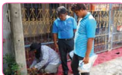
สาขากบินทร์บุรี วันที่ 11 มิถุนายน 2555 ณ บริเวณบ้านโนน หมู่บ้านสันติสุข หมู่บ้านชัยจินดา หน้าโรงพยาบาล กบินทร์บุรี จ.ปราจีนบุรี