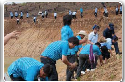
การประปาส่วนภูมิภาคสาขาแม่สอด ร่วมปลูกหญ้าแฝก ณ บ้านทุ่งหลวง ต.แม่จะเรา อ.แม่ระมาด จ.ตาก และแจกน้ำประปาบรรจุขวดจำนวน 150 ขวด ร่วมในงานนี้ด้วย