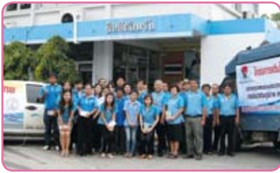
สาขาฉะเชิงเทรา ครั้งที่ 2 วันที่ 18 กรกฎาคม 2555 ณ มหาจักรพรรดิ ต.หน้าเมือง อ.เมือง จ.ฉะเชิงเทรา