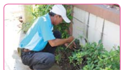
สาขาลพบุรี (ชั้นพิเศษ) ครั้งที่ 4 วันที่ 30 กรกฎาคม 2555 ณ ถ.พระยาจักรี ต.เสม็ด อ.เมือง จ.ชลบุรี

โครงการ 120 ปี มหาคาไทย กปภ.เต็มหัวใจให้ประชาชน เป็นอีกหนึ่งโครงการเพื่อลูกค้าของ กปภ. ที่จะเสริมสร้างความสัมพันธ์อันดีระหว่างผู้ให้และผู้รับบริการ ซึ่งจากการลงพื้นที่ที่ผ่านมาพบว่าลูกค้ามีความพึงพอใจในการออกพบปะเยี่ยมเยียนเป็นอย่างมาก ทั้งนี้ กปภ.ทุกสาขายังคงจัดกิจกรรมอย่างต่อเนื่องเพื่อเพิ่มประสิทธิภาพการให้บริการที่เป็นเลิศต่อไป