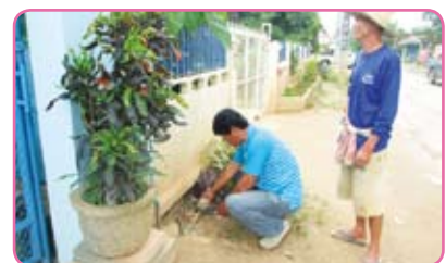
สาขาฟาง วันที่ 11 มิถุนายน 2555 ณ พื้นที่เขตจำหน่ายน้ำของ กปภ.สาขาฟาง