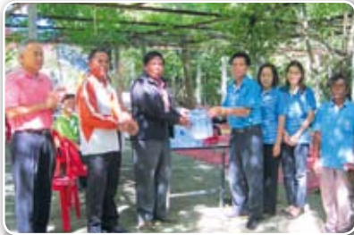
สาขากระบี่ เมื่อวันที่ 12 มิถุนายน 2555

มาดูกันซิว่าในรอบเดือนที่ผ่านมา กปภ.สาขาใด เคลื่อนพลออกหน่วยบริการบำบัดทุกข์ให้ประชาชนกันบ้าง