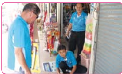
สาขาโนนสูง ครั้งที่ 2 วันที่ 21 มิถุนายน 2555 ณ ชุมชนตลาดใหม่ เขตเทศบาล ตำบลโนนสูง อ.โนนสูง จ.นครราชสีมา