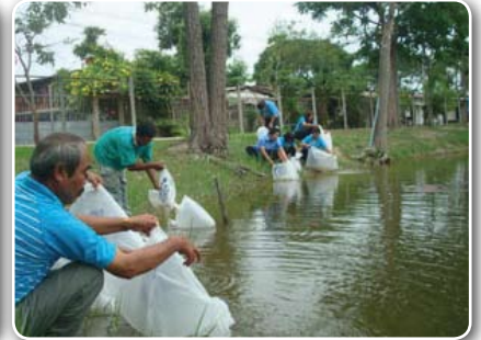
การประปาส่วนภูมิภาคสาขาอุทัยธานี ปลูกต้นไม้จำนวน 100 ต้น และปล่อยปลาตะเพียนในสระน้ำ ภายในสำนักงานการประปาส่วนภูมิภาคสาขาอุทัยธานี