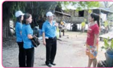
สาขากระบี่ วันที่ 27 มิถุนายน 2555 ณ ชุมชนอ่าวน้ำเมา ม.4 ต.ไสไทย อ.เมือง จ.กระบี่