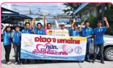
สาขาชลบุรี (วันพิเศษ) ครั้งที่ 2 วันที่ 13 กรกฎาคม 2555 ณ ถนนลงหาดบางแสน ต.แสนสุข อ.เมือง จ.ชลบุรี