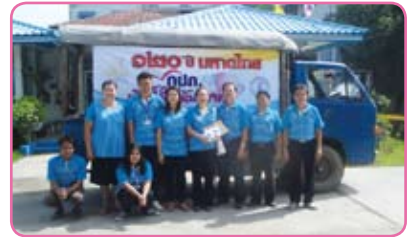
สาขามันนา วันที่ 28 มิถุนายน 2555 ณ หน่วยบริการองค์กรฯ ตลาดองค์กรฯ อ.องค์กรฯ จ.นครนายก