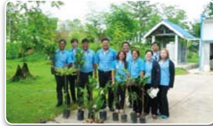
การประปาส่วนภูมิภาคสาขาสุโขทัย ร่วมปลูกต้นไม้บริเวณหน่วยบริการบ้านด่านลานหอย อ.บ้านด่านลานหอย จ.สุโขทัย เนื่องในวันต้นไม้ประจำปีของชาติ