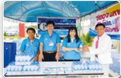
สาขาเชียงใหม่ เมื่อวันที่ 13 มิถุนายน 2555