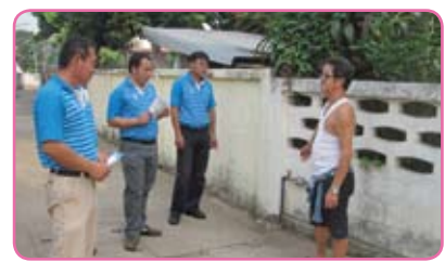
สาขาน่าน ครั้งที่ 3 วันที่ 21 มิถุนายน 2555 ณ ชุมชนหมู่บ้านนาราบ อ.น่าน้อย จ.น่าน