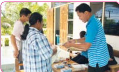
สาขาบางสะพาน ครั้งที่ 2 วันที่ 11 กรกฎาคม 2555 ณ บริเวณชุมชนบ้านทุ่งกอก ม.5 ต.ทับสะแก อ.ทับสะแก จ.ประจวบคีรีขันธ์