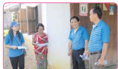
สาขาทุ่งเสลี่ยม ครั้งที่ 2 วันที่ 11 กรกฎาคม 2555 ณ บ้านเด่นดีมี ต.ทุ่งเสลี่ยม อ.ทุ่งเสลี่ยม จ.สุโขทัย