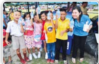
สาขาชลบุรี เมื่อวันที่ 19 มิถุนายน 2555