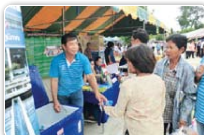
สาขาอุทัยธานี เมื่อวันที่ 21 มิถุนายน 2555