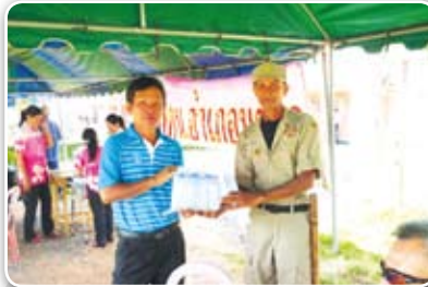
สาขามหาสารคาม เมื่อวันที่ 13 มิถุนายน 2555