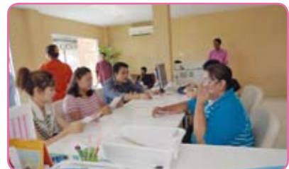
สาขาสามพราน ครั้งที่ 3 วันที่ 7 กรกฎาคม 2555 ณ อบต.สามควายเผือก อ.เมือง จ.นครปฐม