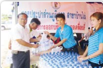
สาขabanไผ่ เมื่อวันที่ 13 มิถุนายน 2555