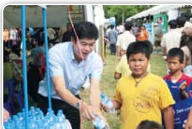
สาขาบางคล้า เมื่อวันที่ 21 มิถุนายน 2555