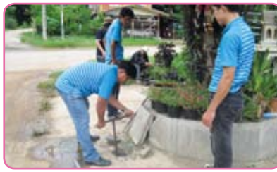
สาขาเพชรบูรณ์ วันที่ 18 กรกฎาคม 2555 ณ บ้านป่าเลา ต.ป่าเลา อ.เมือง จ.เพชรบูรณ์