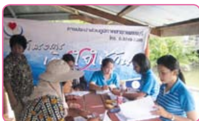
สาขาเพชรบุรี ครั้งที่ 2 วันที่ 8 มิถุนายน 2555 ณ ศาลากลางหมู่บ้าน บ้านนาป่า ม.8 ต.บางครก อ.บ้านแหลม จ.เพชรบุรี

ในช่วงเดือนมิถุนายน-กรกฎาคม 2555 กปภ.สาขาต่าง ๆ ได้ออกกิจกรรมพบปะลูกค้าในโครงการ 120 ปี มหาไถไทย กปภ. เติมน้ำใจให้ประชาชน ดังนี้