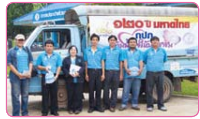
สาขาเวียงเชียงทอง ครั้งที่ 8 วันที่ 19 กรกฎาคม 2555 ณ บ้านหัวเวียง ม.1 ต.เวียง อ.เชียงทอง จ.เชียงราย