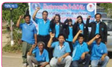
สาขาชัยนาท ครั้งที่ 6 วันที่ 25 กรกฎาคม 2555 ณ ตลาดเก่าและตลาดใหม่ ต.หันคา อ.หันคา จ.ชัยนาท