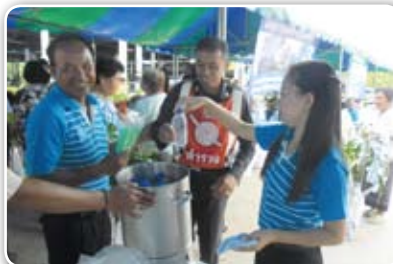
สาขาหนองเรือ เมื่อวันที่ 18 มิถุนายน 2555