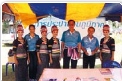
สาขาสว่างแดนดิน เมื่อวันที่ 19 มิถุนายน 2555