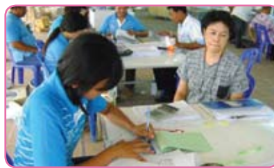
สาขาเพชรบุรี ครั้งที่ 3 วันที่ 21 มิถุนายน 2555 ณ ตลาดทรัพย์สินส่วนพระมหากษัตริย์ จ.เพชรบุรี