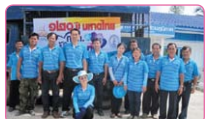
สาขาลาดยาว ครั้งที่ 2 วันที่ 17 กรกฎาคม 2555 ณ ต.หนองนมวัว ม.3,5,6 ต.หนองยาว ม.1,2,3,5,6 อ.ลาดยาว จ.นครสวรรค์