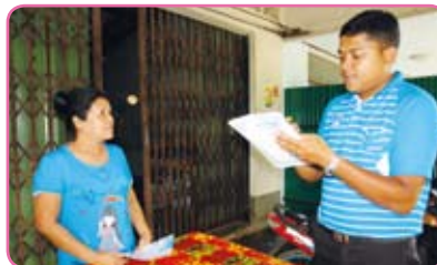
สาขาตะกั่วป่า วันที่ 5 กรกฎาคม 2555 ณ ต.บ้านคำแก่น ต.ทุ่งมะพร้าว อ.ท้ายเหมือง อ.คึกคัก อ.ตะกั่วป่า จ.พังงา