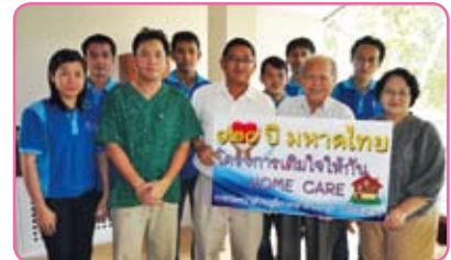
สาขาลพบุรี (ชั้นพิเศษ) ครั้งที่ 3 วันที่ 23 กรกฎาคม 2555 ณ ถนนลงหาดบางแสน ต.แสนสุข และถนนพระยาจักรี ต.เสม็ด อ.เมือง จ.ชลบุรี