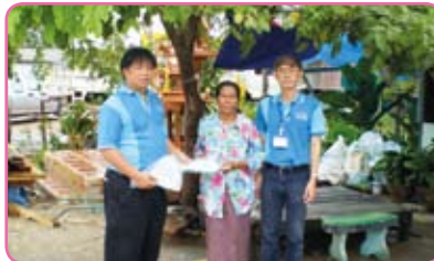
สาขางบอง ครั้งที่ 7 วันที่ 20 กรกฎาคม 2555 ณ ม.5 ต.เขาหิน อ.บางปะกง จ.ฉะเชิงเทรา