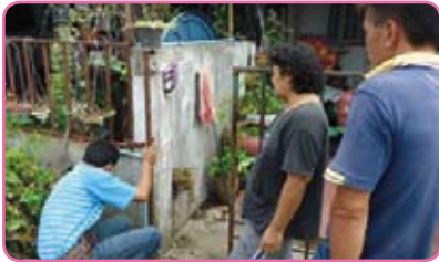
สาขาล่มสัก ครั้งที่ 3 วันที่ 19 กรกฎาคม 2555 ณ ถนนหน้า รพ.ล่มสัก บ้านบึงยาง อ.ล่มสัก จ.เพชรบูรณ์