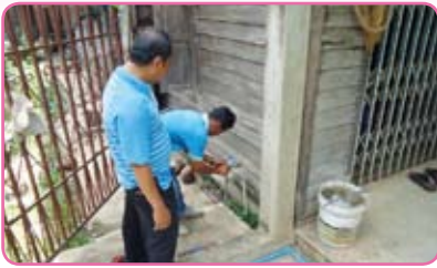
สาขาสวรรคโลก ครั้งที่ 2 วันที่ 21 มิถุนายน 2555 ณ เทศบาลตำบลศรีนคร อ.ศรีนคร จ.สุโขทัย