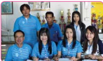
สาขาเชียงใหม่ (ชั้นพิเศษ) ครั้งที่ 4 วันที่ 23 กรกฎาคม 2555 ณ บริเวณ วัดป่าแดด ม.13 ต.ป่าแดด อ.เมือง จ.เชียงใหม่