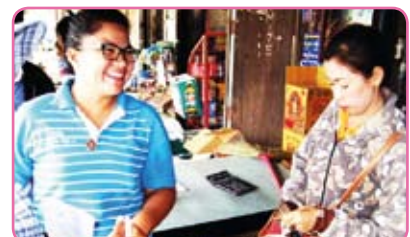
สาขากุญบุรี วันที่ 26 กรกฎาคม 2555 ณ ม.1.2 อ.กุญบุรี จ.ประจวบคีรีขันธ์