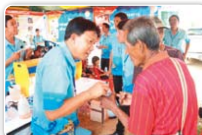
สาขากำแพงเพชร เมื่อวันที่ 28 มิถุนายน 2555