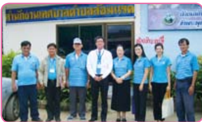
สาขาเถิน ครั้งที่ 6 วันที่ 28 มิถุนายน 2555 ณ อบต.แม่ปะ เทศบาลตำบลเถินบุรี เทศบาลลุ่มมรดก อ.เถิน จ.ลำปาง