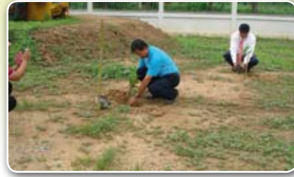
การประปาส่วนภูมิภาคสาขาศรีสำโรง ร่วมปลูกต้นไม้เนื่องในวันปลูกต้นไม้ประจำปีของชาติ ณ สำนักทางหลวงที่ 4 (พิษณุโลก) สำนักงานหมวดการทางศรีสำโรงแขวงการทางสุโขทัย