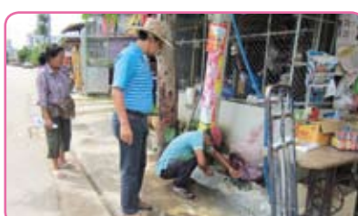
สาขาวิเชียรบุรี ครั้งที่ 2 วันที่ 29 กรกฎาคม 2555 ณ ชุมชนพุเตยพัฒนา ม.1 ต.พุเตย อ.วิเชียรบุรี จ.เพชรบูรณ์