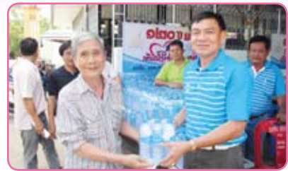
สาขามันเหมี่ ครั้งที่ 2 วันที่ 27 มิถุนายน 2555 ณ บริเวณวัดวังจั่น อ.วังจั่น และชุมชนหมู่บ้านถลุงเหล็ก อ.โคกสำโรง จ.ลพบุรี