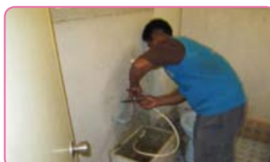
สาขาเดิมบางนางบวช ครั้งที่ 4 วันที่ 13 กรกฎาคม 2555 ณ บ้านกุ่มมะเขียร ต.เขาพระ อ.เดิมบางนางบวช จ.สุพรรณบุรี