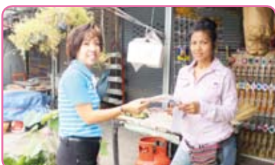
สาขางบอง ครั้งที่ 8 วันที่ 27 กรกฎาคม 2555 ณ ม.6 ต.ท่าข้าม อ.บางปะกง จ.ฉะเชิงเทรา