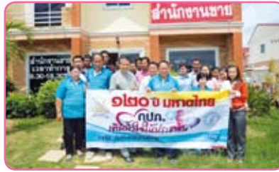
สาขาสามพราน ครั้งที่ 2 วันที่ 26 มิถุนายน 2555 ณ หมู่บ้านศิวารรัตน์ 10 ต.บางแถม อ.เมือง จ.นครปฐม