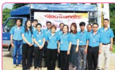
สาขาดาก ครั้งที่ 3 วันที่ 11 กรกฎาคม 2555 ณ ม.3 ต.ประดาง อ.วังเจ้า จ.ตาก