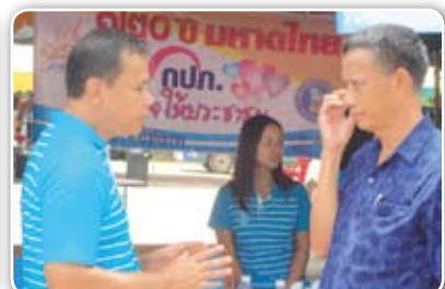
สาขาชัยนาท เมื่อวันที่ 21 มิถุนายน 2555